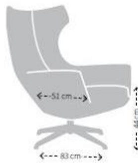
DIEPTE, ZITDIEPTE EN ZITHOOGTE